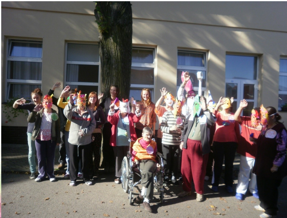
Klienti Domova pro osoby zdravotně postižené Srdce v domě, Klentnice, 2014.