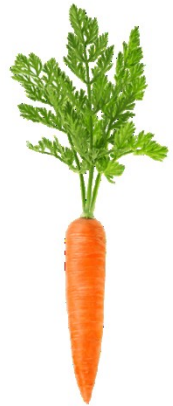
mrkev obecná setá

https://img.leros.cz/userimages/herb_main/57/1312_54fdd81688a9129380ebe8876439fa5a_medium.png