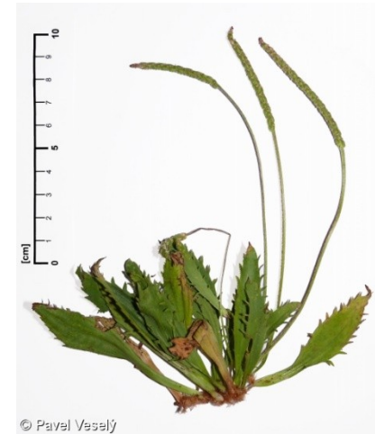
jitrocel vraní nožka