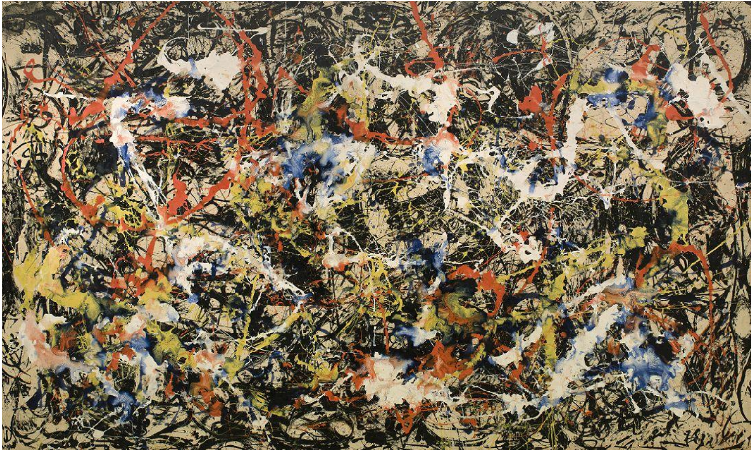
Jackson Pollock, Convergence, 1952