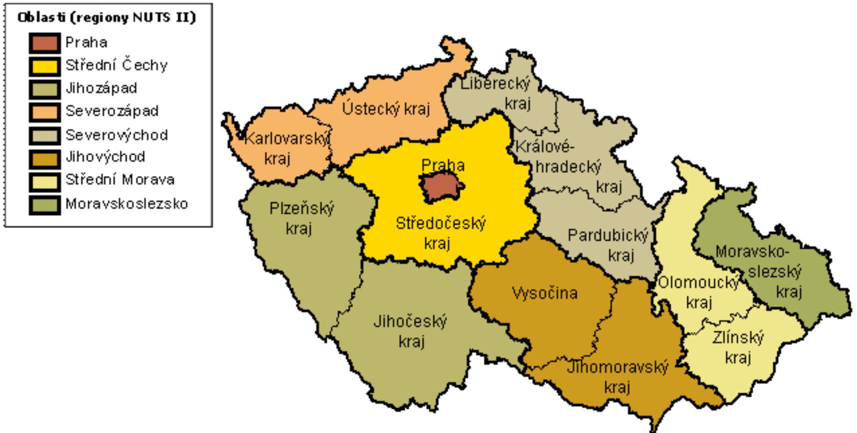
Mapka regionů NUTS II a NUTS III (krajů)