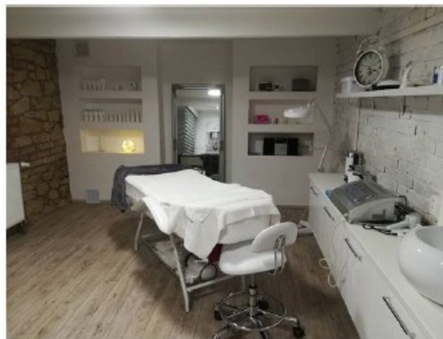
Obrázek 1 Fiktivní firma 1 - Inspirativní foto převzato ze Skinlogic: Fotogalerie [online]. 2017 [cit. 2020-03-06].