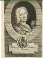
Matyáš Bernard Braun - sochař (1684 – 1738)