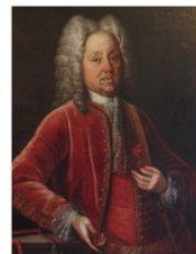
František Antonín hrabě Špork