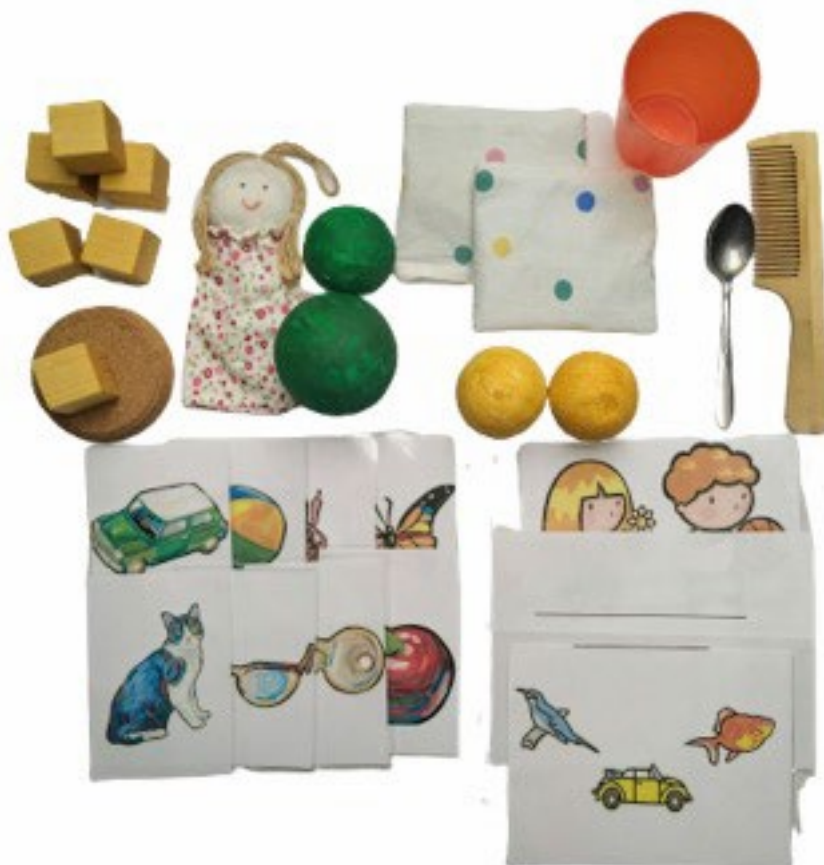
Obrázok 1: Materiál na vyšetrenie porozumenia v rámci Funkčnej vývinovej diagnostiky