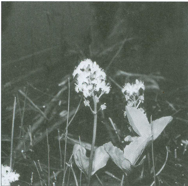
Obr. 21 Nápadným hydrofytem je také mizející vachta trojlístá ( Menyanthes trifoliata )

Submerzní druhy rostlin mají ponořené asimilační orgány a buď se vznášejí, nebo jsou uchyceny kořeny na dně. Listy natantních druhů vzplývají na hladině a jejich povrchová morfologie (kutikula, průduchy) i fotosyntéza jsou již blízké terestrickým druhům. Emerzní rostliny mají asimilační orgány nad vodní hladinou. Některé druhy rostlin mohou mít listy dvou nebo dokonce tří různých typů.