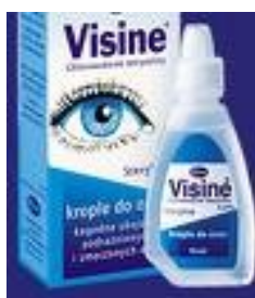
kapky do očí