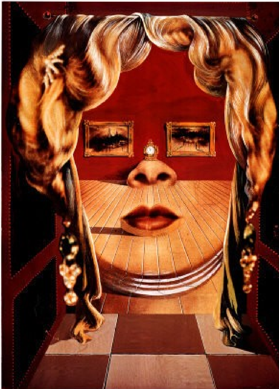
SALVADOR DALÍ FACE OF MAE WEST 1935