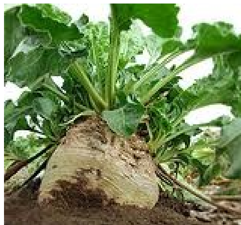
4. řepa Původ: Z Asie