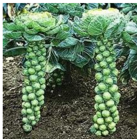
2. růžičková kapusta Původ: J Evropa