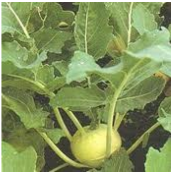
7. kedluben Původ: J Evropa