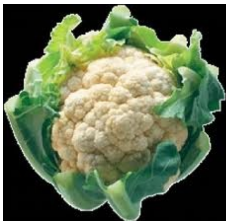
3. květák Původ: JZ Asie