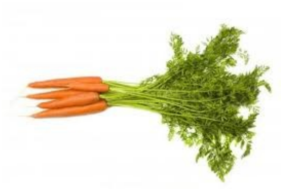
5. mrkev Původ: J Asie