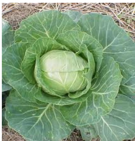
1. zelí Původ: Evropa