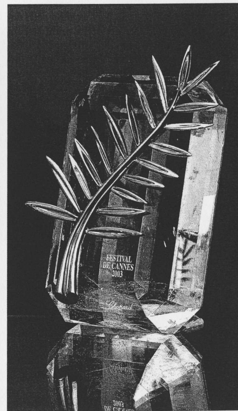
|Hlavní cenou Mezinárodního filmového festivalu v Cannes je Zlatá palma. Foto © AFFIF |Pověstný červený koberec před Festivalovým palácem. Foto © AFFIF

Jako nováček jsem se tehdy v Cannes teprve začínala orientovat, ale iednak se mnou bvli čeští