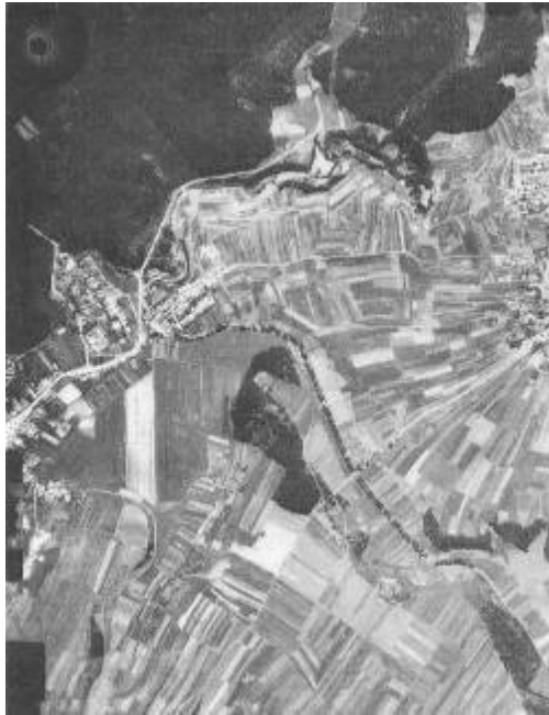
Letecký snímek z roku 1953