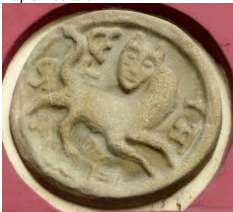
LEVÍNSKÝ KOCOUR, vlevo náčrt dle Augusta Sedláčka, vpravo jedno z písmen.