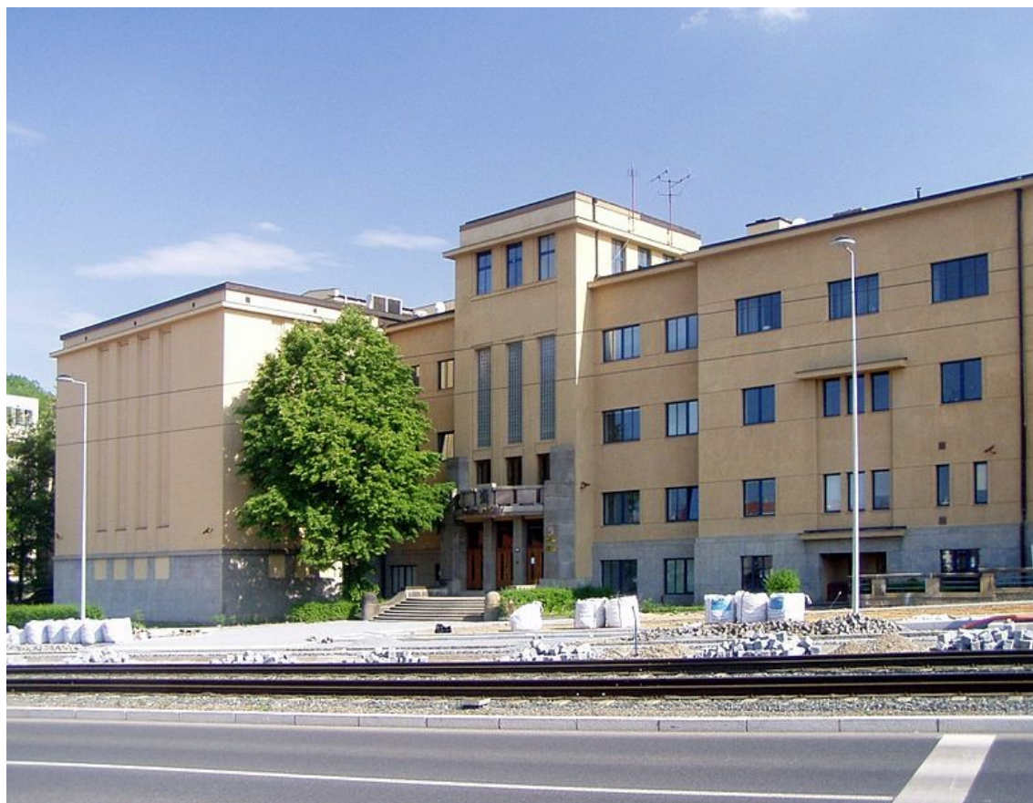
Budova Národního archivu v Praze na ul. Milady Horákové (starší fondy)

Z významných souborů speciálně zvukových dokumentů lze jmenovat alespoň Sbírku gramofonových desek , obsahující především projevy významných představitelů státu od 20. do poloviny 70. let 20. století. Dále Sbírku zvukových záznamů radionaslouchací služby z let 1931-1953, kterou zatím nelze zpracovat pro absenci technického zařízení.