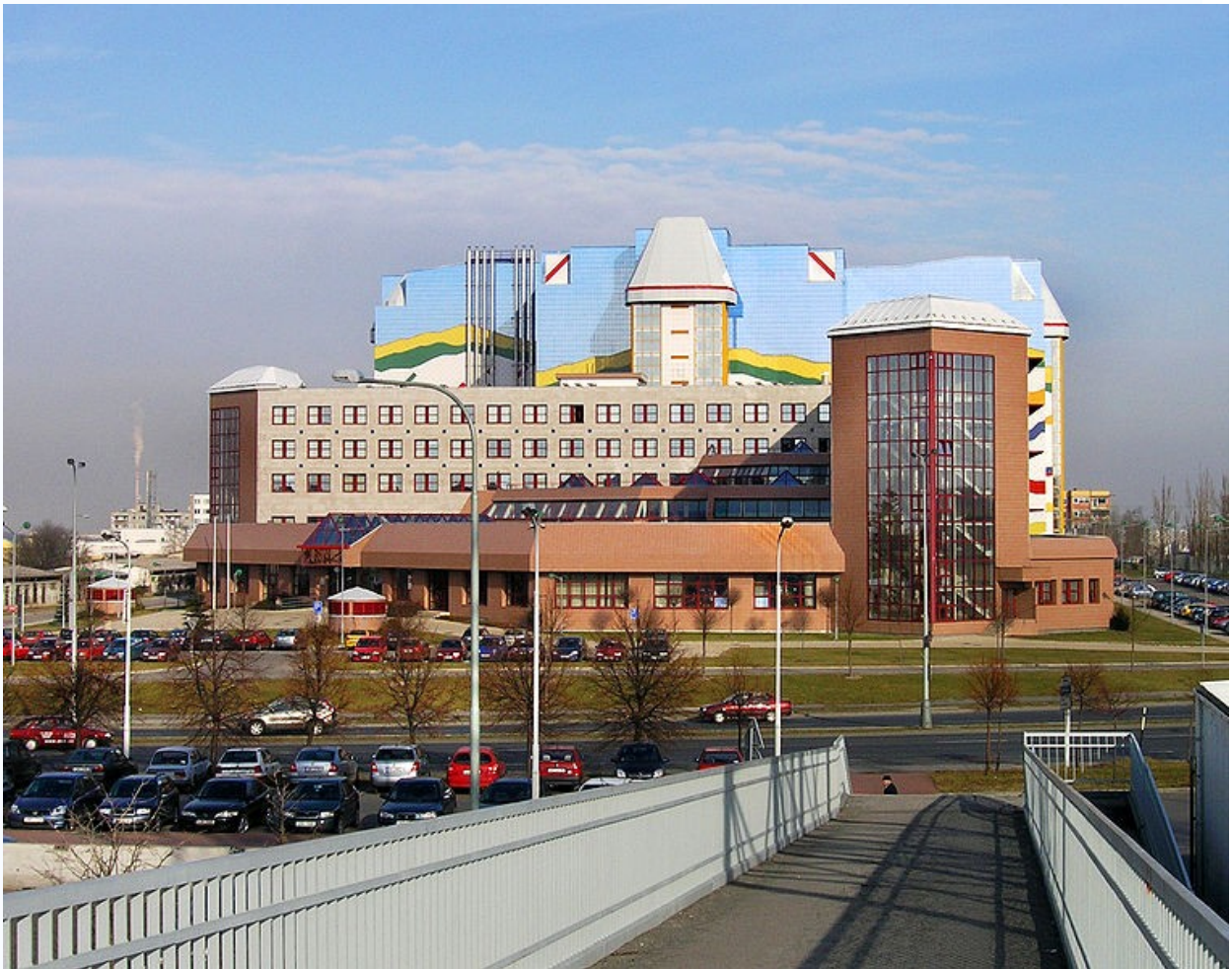
Budova Národního archivu v Praze na Chodovci