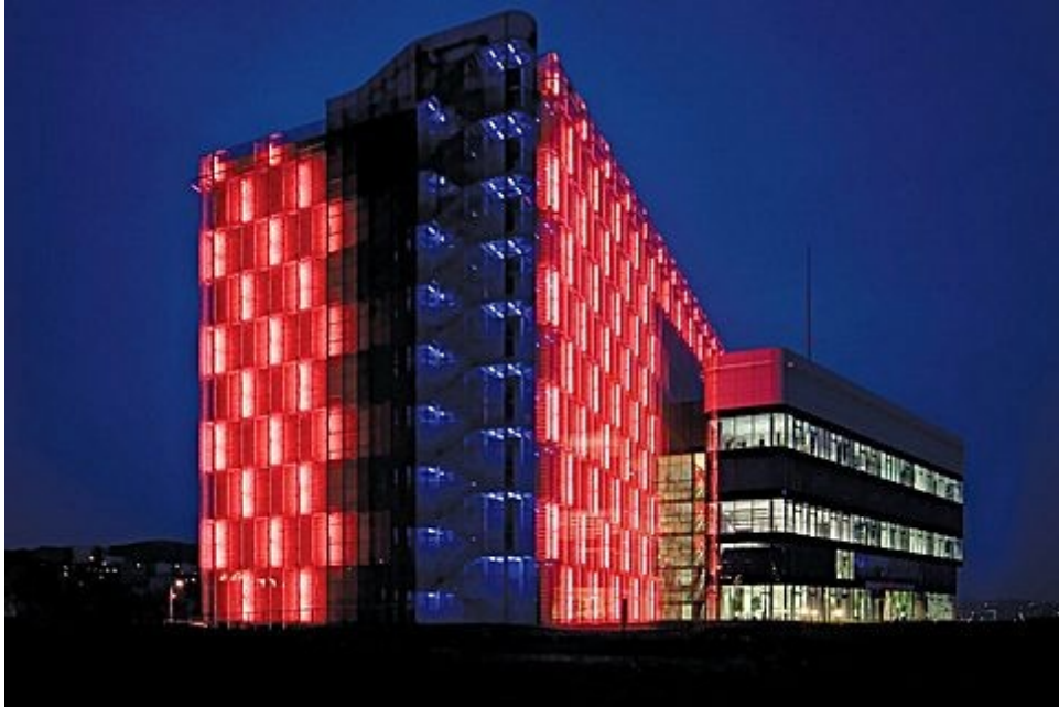
Nová budova MZA Brno – Bohunice, Palachovo náměstí