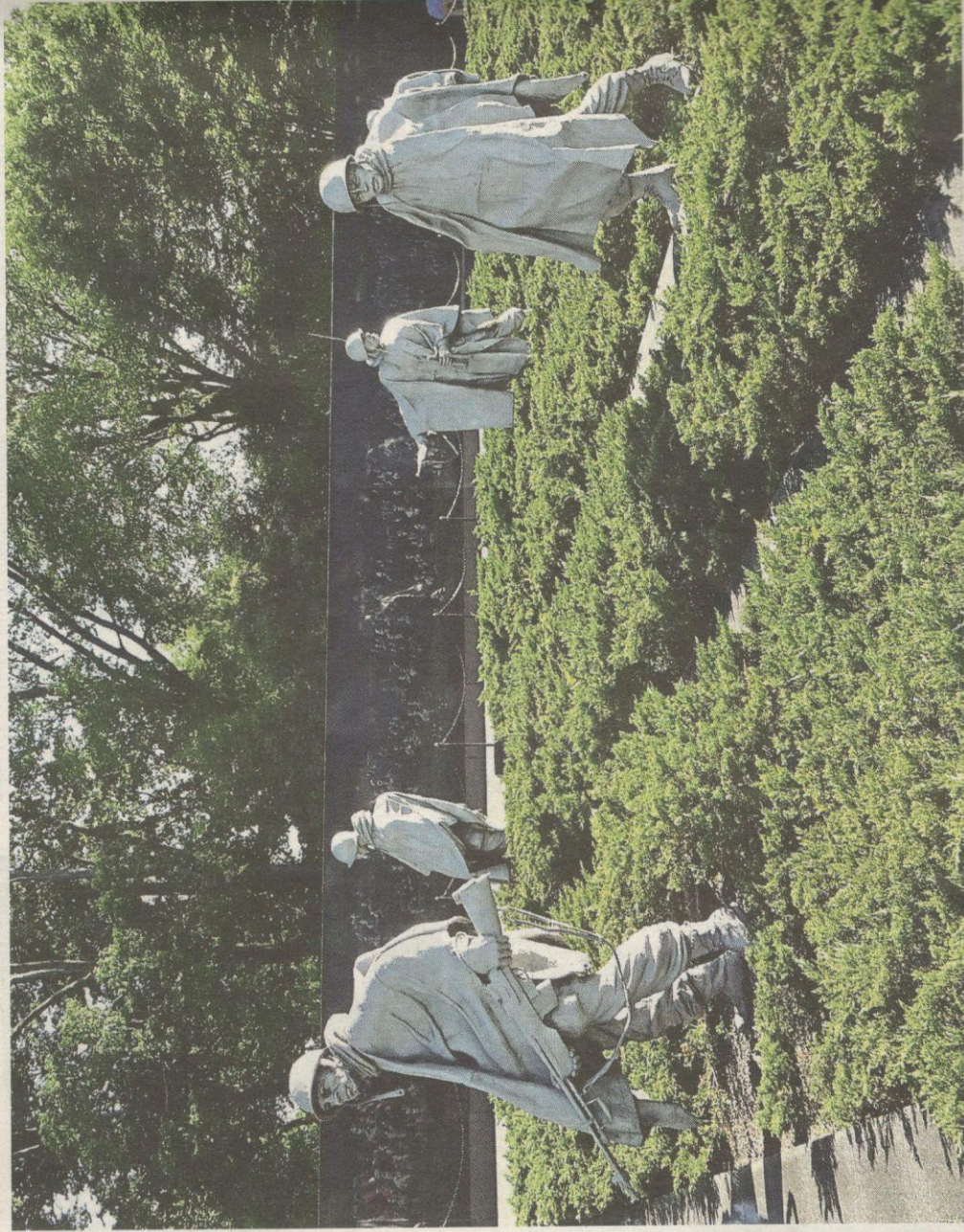
Korean War Veterans Memorial tvoří mírně nadživotní postavy vojáků, vypadají skutečně jako živi...