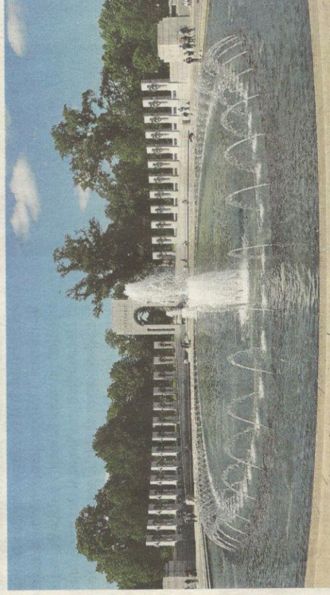
World War II Memorial je rozdělen na dva segmenty s kašnou uprostřed

architekta Alberta Speera. Nejde jen o kamenné prvky, ale také bronzové věnce nesoucí orly umístěné v obou pavilonech. Trochu nejasná je i další symbolika – na zdi, součástí pomníku, je umístěno 4048 zlatých hvězdiček, z nichž ovšem každá reprezentuje hned stovku válečných obětí. Počáteční bouřlivé debaty nad pojetím díla ale v poslední době ustávají, lidé si na monument zřejmě zvykli.