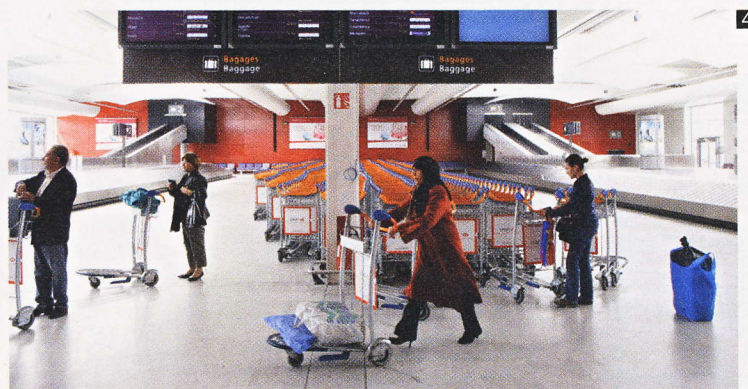
1 2 Une zone commerciale spacieuse et variée. | A spacious and attractively different shopping area. 3 Une circulation des passagers plus fluide. | Smoother flowing passenger circulation. 4 Une livraison des bagages plus efficace. | More efficient baggage delivery.