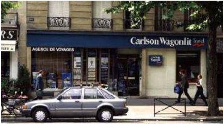
une agence de voyages

Je projette un voyage au Maroc: pouvez-vous me fournir des renseignements?