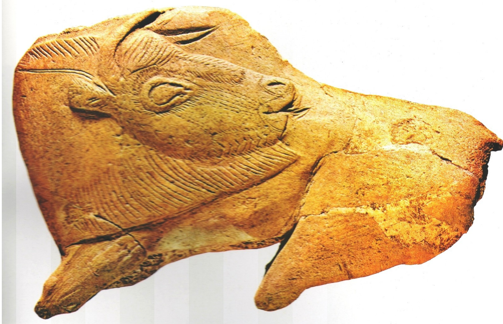
Řezba bizona v sobím parohu, nalezená v jeskyni La Madeleine ve Francii (muzeum v Saint-Germain-en-Laye). Neobvyklá poloha hlavy, která patrně naznačuje, že si zvíře olizuje bok. Velikost 10 cm.