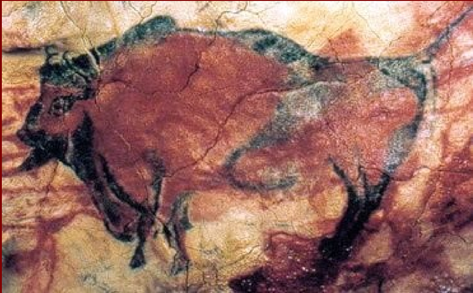
Bizon, asi 15 000 – 10 000 př.n.l., malba v jeskyni Altamira, Španělsko