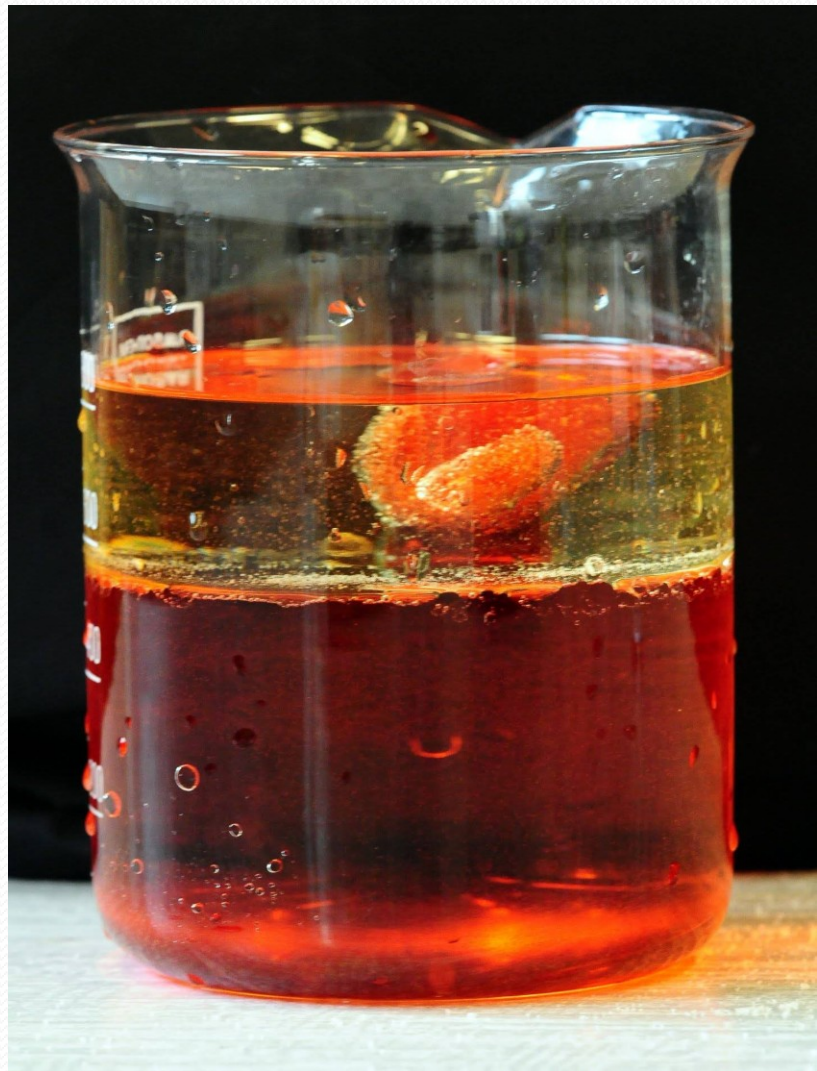
Obr. 2.: Fázové rozhraní olej a voda

● Vyrábí se zkoncentrováním mléčného tuku mechanickými postupy.