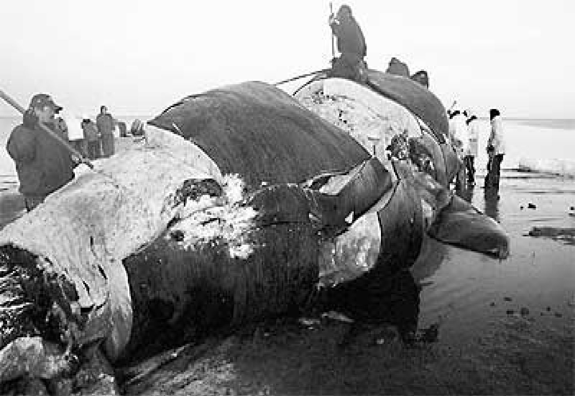
Obr. 1.: Získávání podkožního tuku z velryby.