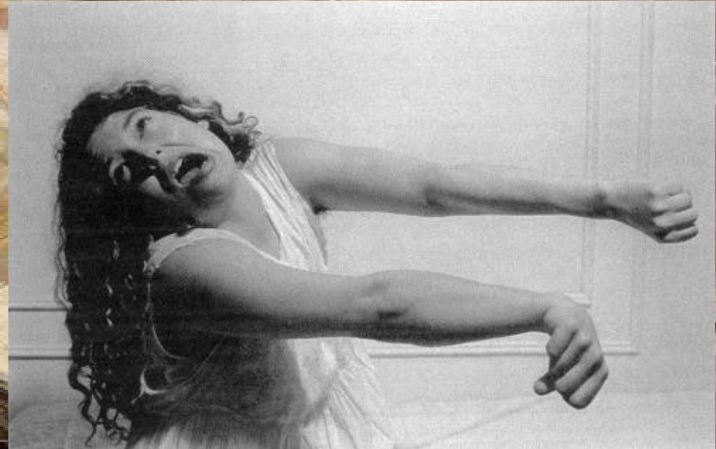
T. III. PL. XVIII