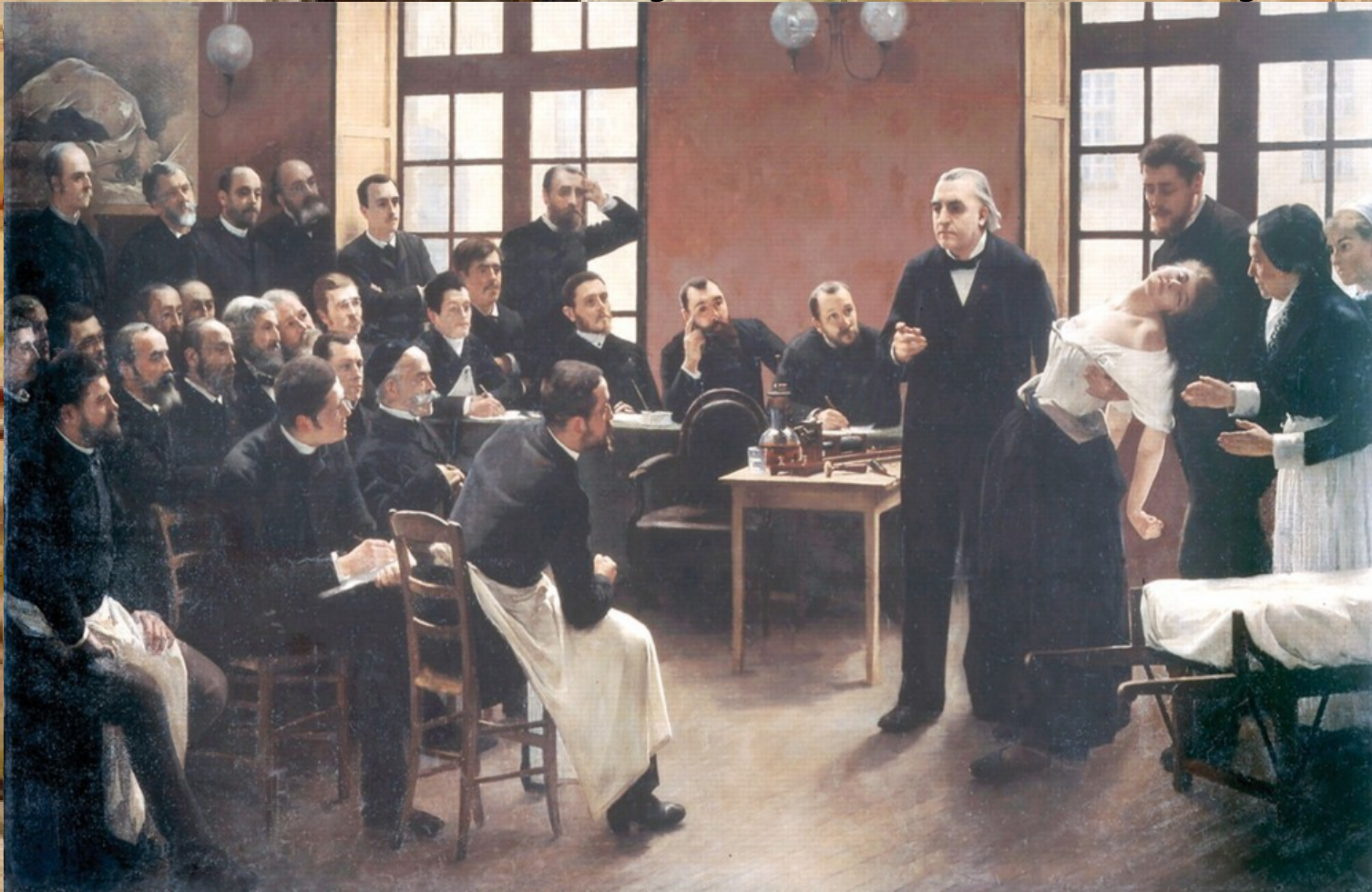
Andrého Brouillet - Klinická lekce na Salpêtrière (1887)