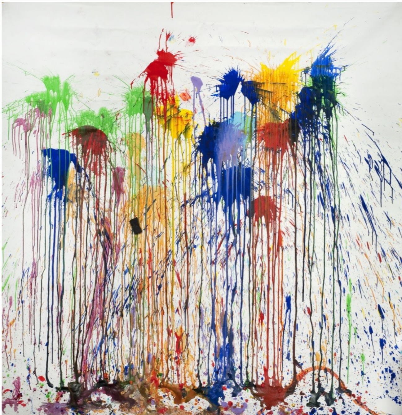
Obyvatelé domova důchodců Brno, Podpěrova, 2013.