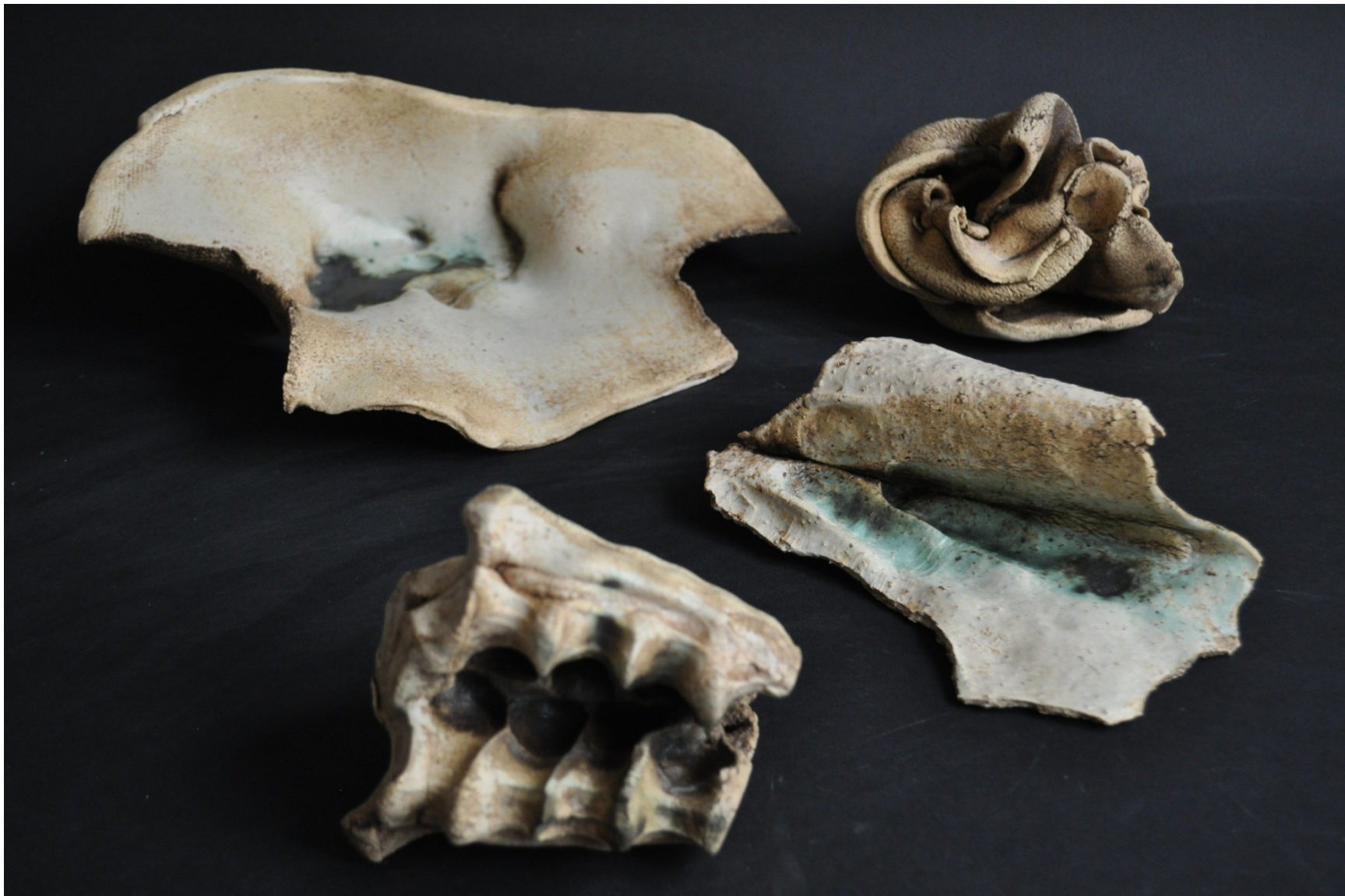
Klienti z diagnostického ústavu pro mládež Brno, 2016.