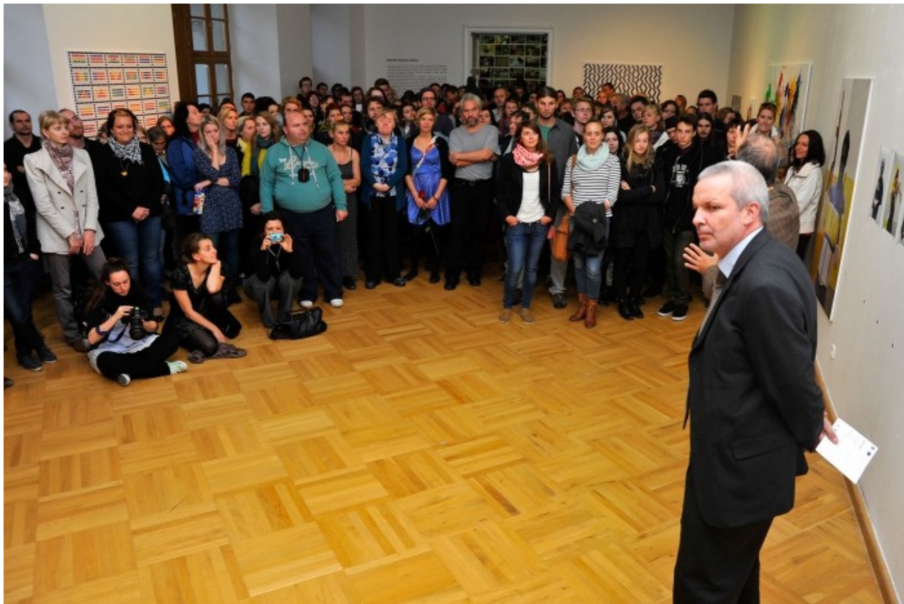
Vernisáž výstavy Creative help v Domě pánů z Kunštátu, 2013.