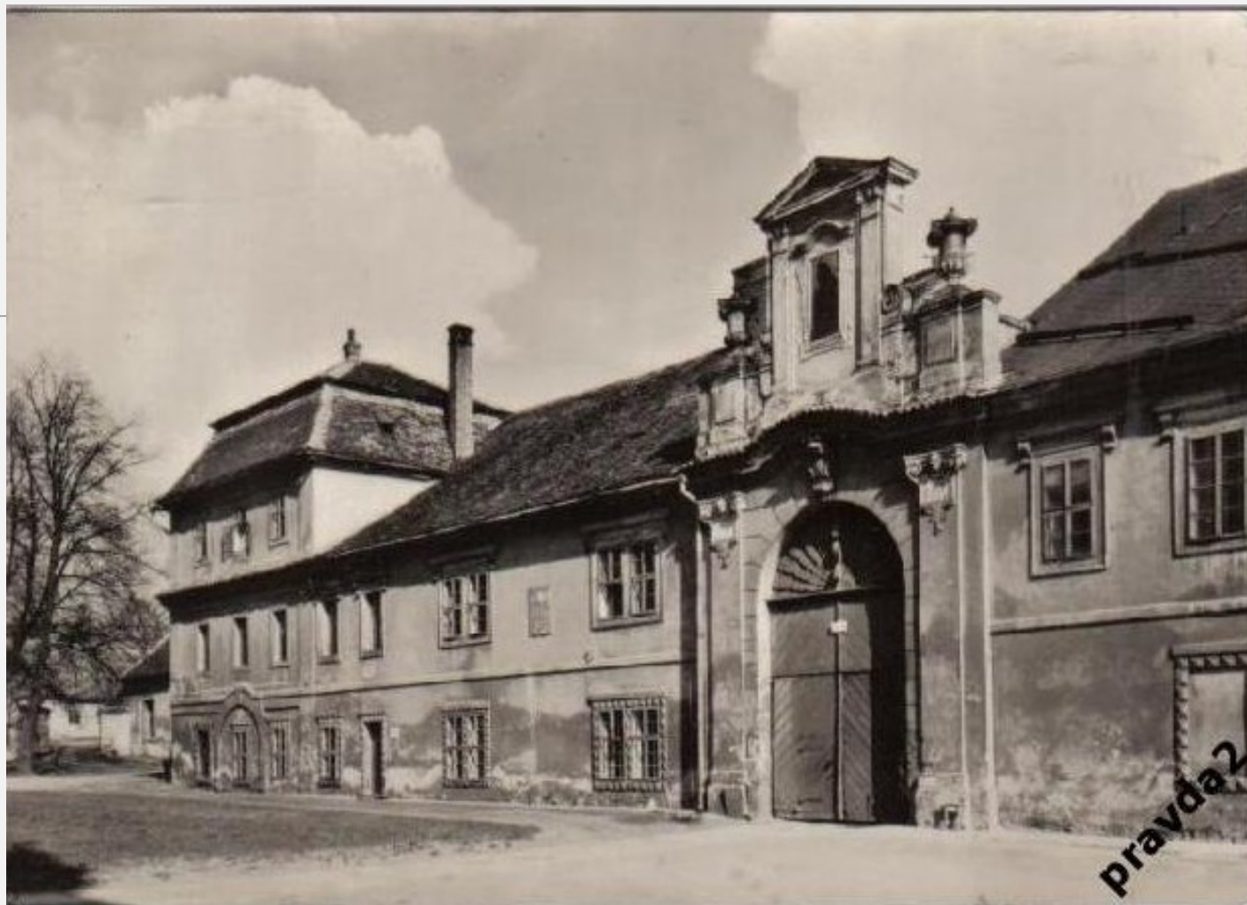
Litomyšl - rodný dům Bedřicha Smetany