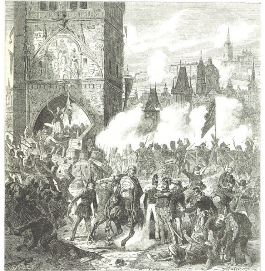
Der Aushilfs-Studenten in Prag am 15. Juni 1848.