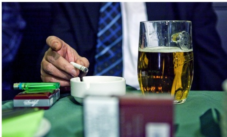
(ilustrační snímek)

Česká republika je nejnezdравější zemí na světě, pokud jde o kombinaci konzumace alkoholu a tabáku a o počet obézních lidí. Vyplyvá to ze srovnávací studie 179 zemí světa, o které informoval britský server Clinic Compare, který se opírá o veřejně dostupná data Světové zdravotnické organizace, americké Ústřední zpravodajské služby a Světové plicní organizace.