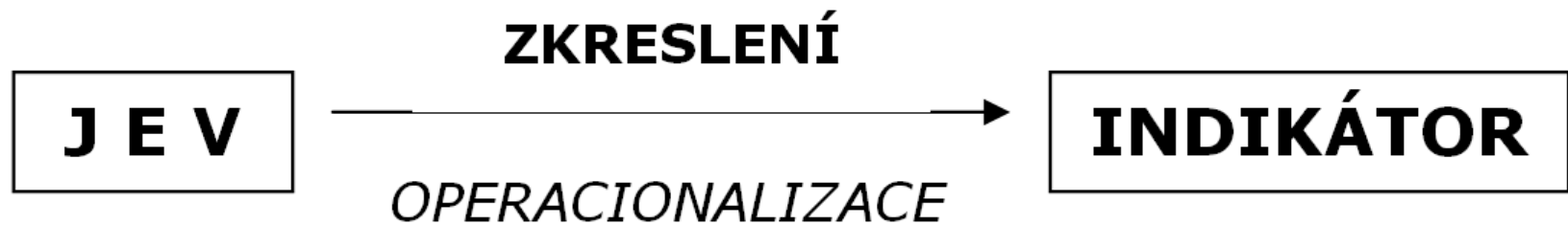
Schéma 3. Vztah mezi pojmem a indikátorem