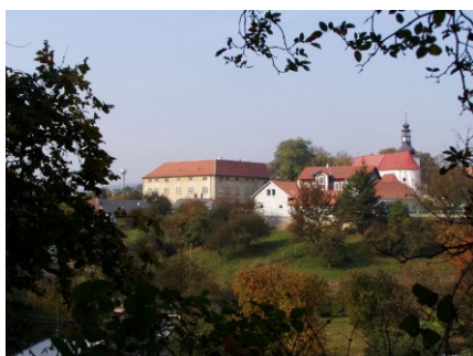
Obr.: Pohledová osa

Genius loci je duch místa. Zahrnuje pozitivní i negativní vnímání krajiny. Bývá důvodem proč se na určité místo opakovaně vracíme. Geniem loci mohou být např. hrady, zámky, bojiště, hřbitovy, boží muka, památníky, vodní plochy či průmyslová architektura.