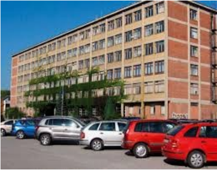
Obr. : Dominanta 1

Dominanta je pohledově významný prvek v urbanistické kompozici. Může se jednat o budovu či přírodní útvar, který má výzazný vliv na strukturu města či krajiny. Okolí napomáhá dominantě k tomu, aby vynikla.