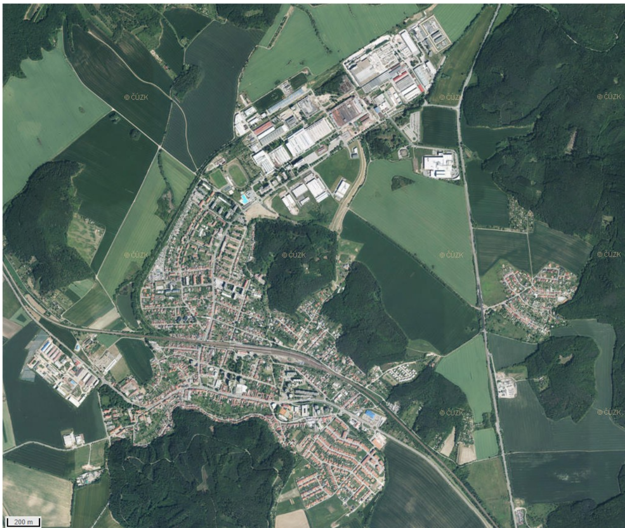
Obr. : Letecký snímek Kuřimi

2. Každý skupina obdrží letecký snímek Kuřimi, do kterého si v programu Malování dané krajiny prvky zaznačí a bude stanovena trasa terénního šetření. Jednotlivé krajiny prvky si označíte v mapě jako bod a pomocí linie je spolu navzájem spojíte, abyste vytvořili okruh, který v rámci terénní výuky absolvujete. Začátek a konec terénního šetření bude před budou ZŠ Jungmannova, dané místo označíte oranžovým bodem.