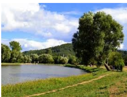
Obr. : Místo s geniem loci

Příklady krajinotvorných prvků ve městě Kuřim: