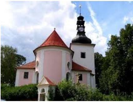
Obr. : Dominanta 2

Dominanta je pohledově významný prvek v urbanistické kompozici. Může se jednat o budovu či přírodní útvar, který má výzazný vliv na strukturu města či krajiny. Okolí napomáhá dominantě k tomu, aby vynikla.