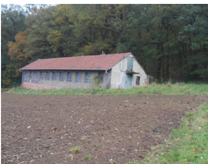
Obr. : Zanedbané místo

Pohledová zábrana je bariéra či překážka, která brání výhledu.