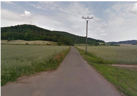
Obr. : Pohledová zábrana

Osa – cesta může spojovat významné cíle v městské struktuře nebo v krajině.