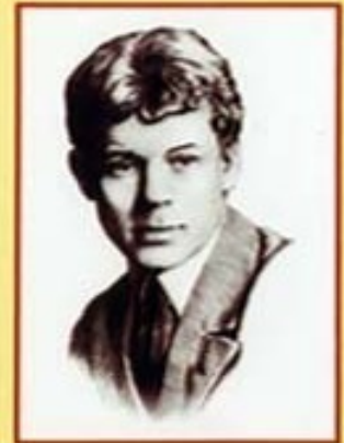
ЕСЕНИН Сергей Александрович (1895-1925)