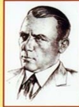
БУЛГАКОВ Михаил Афанасьевич (1891-1940)