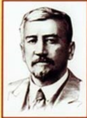
КУПРИН Александр Иванович (1870-1938)