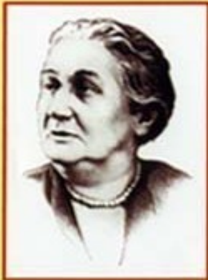
АХМАТОВА Анна Андреевна (1889-1966)