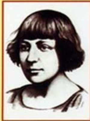
ЦВЕТАЕВА Марина Ивановна (1892-1941)