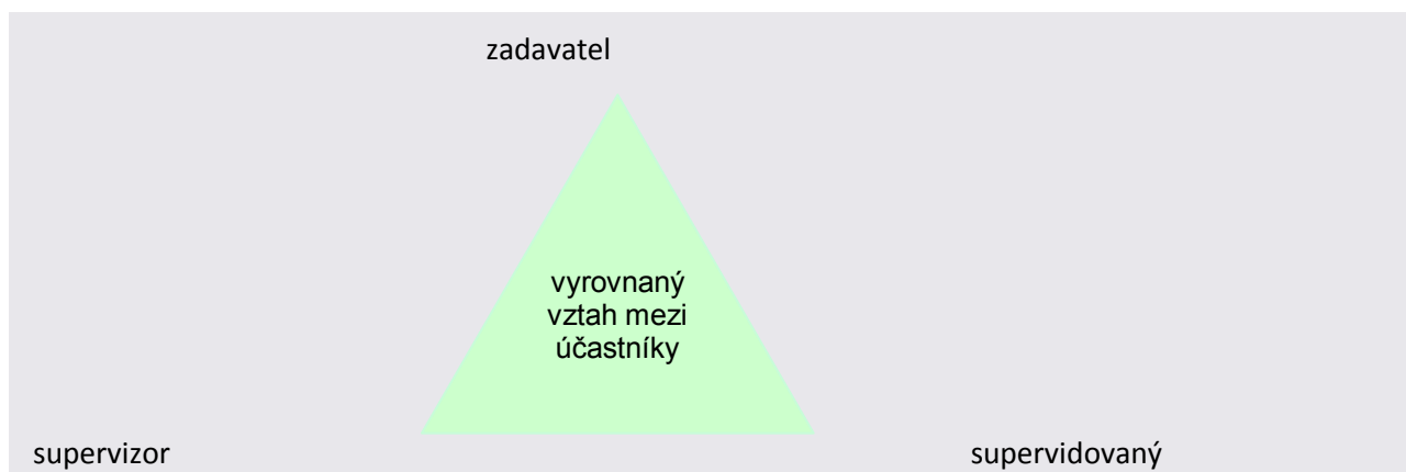
Obr. : Optimální supervizní vztah v organizaci

Hewson (in Rollová, 2002) vystihuje optimální stav rovnostranným trojúhelníkem, ve kterém je mezi všemi stranami stejná vzdálenost.