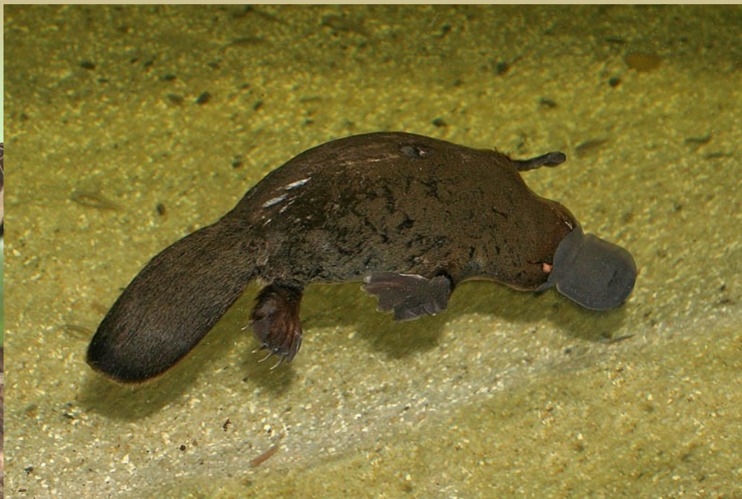
Ptakopysk (podivný) (biolib.cz)