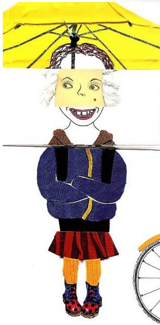
★ Ilustrace z knihy D. Urbánkové: Cirkus ulice .