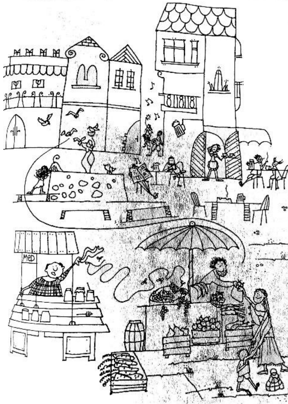
★ Ilustrace z knihy K Hoškové: Tvůrčí psaní pro malé spisovatele a spisovatelky.