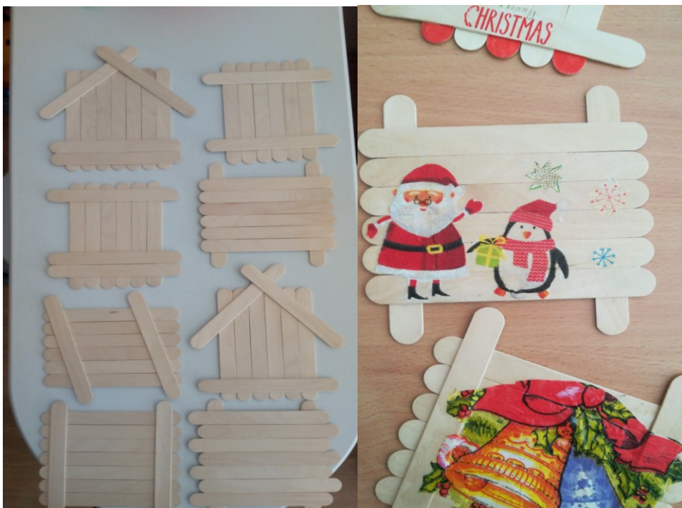
Příloha č. 7