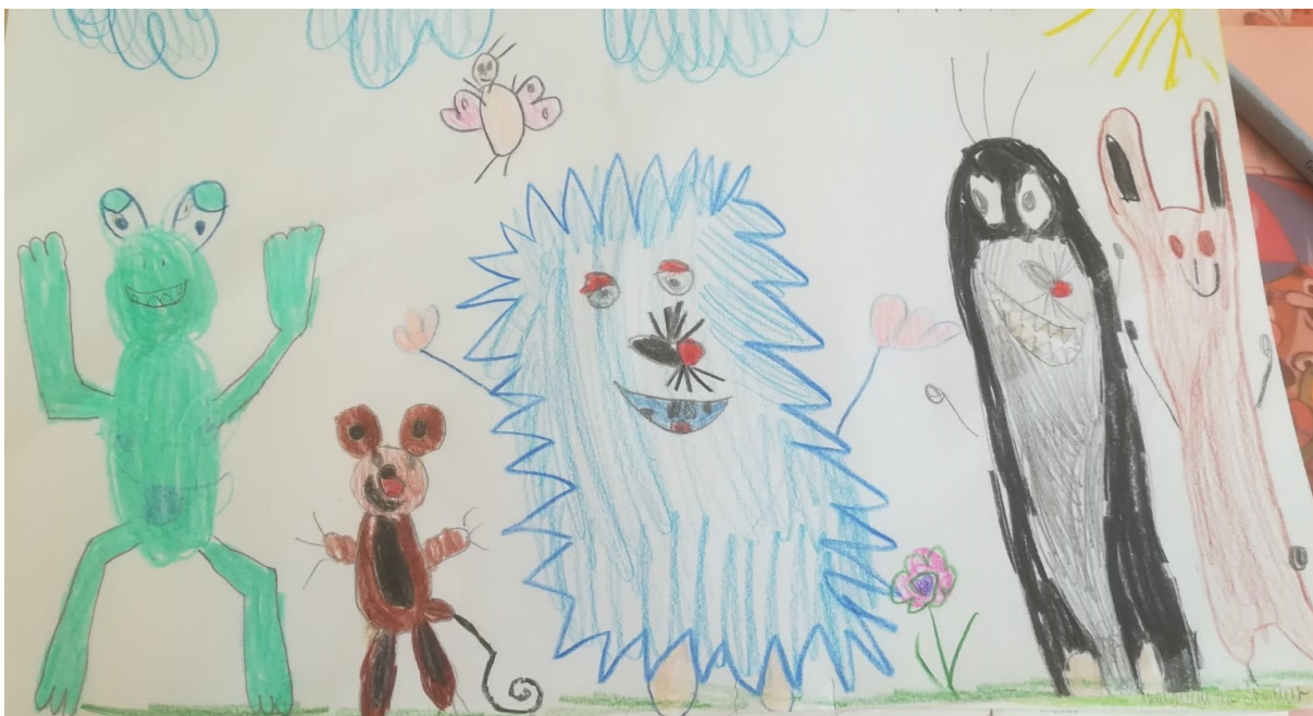
Příloha č. 4