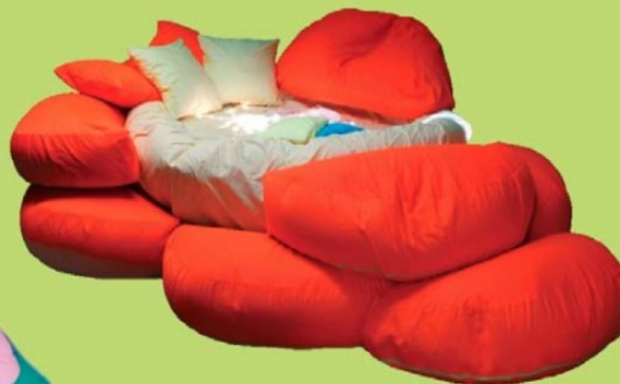
TRAMPOLÍNA POLOHOVACÍ Ø 320 cm vč. 8 ks okvětních lístků o velikosti 100 x 60 x 40 cm 7,0609,2020