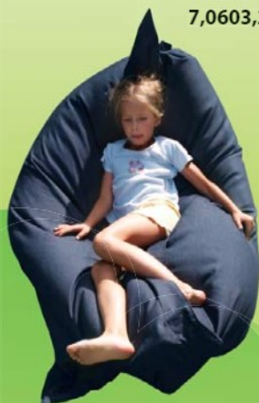
MAZLÍČEK 130 x 180 cm 7,0603,2011