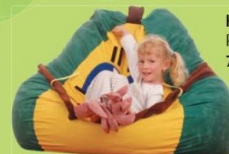
HRUŠKA Polohovací křeslo 7,0602,0001