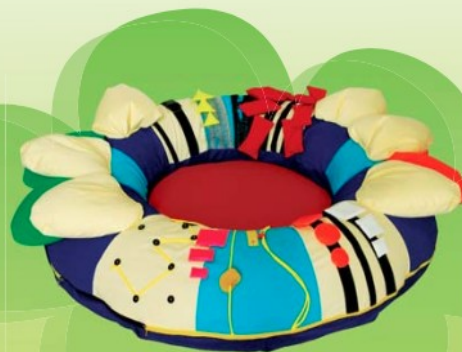
SLUNEČNICE +PRVKY MORTORIKY Ø 120 cm 7,0604,0003