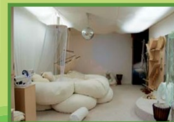
Masarykova univerzita Brno