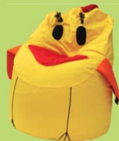
KURE Polohovací křeslo 7,0601,0001