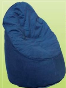
VAK Polohovací křeslo 7,0603,2001