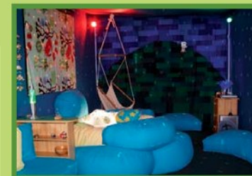
Vzdělávací centrum Snoezelen konceptu Ostrava