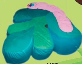
LIST Polohovací lehátko 7,0609,2001