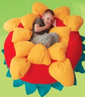
SLUNEČNICE Polohovací křeslo 7,0604,0001