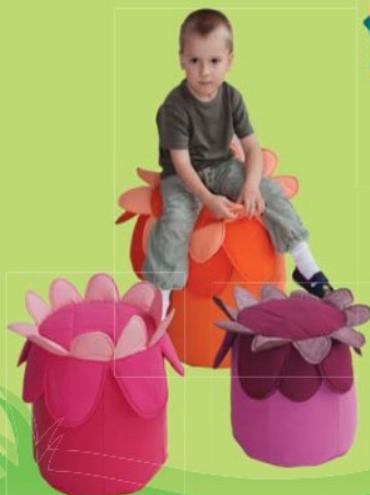
TABURETKA KVĚTINKA Sedák 7,0607,2001