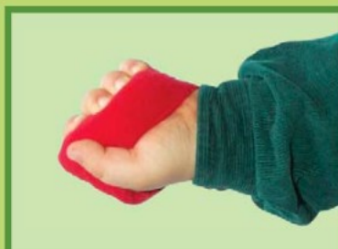
SPASMA ŠÁTEČEK 7,0906,1001