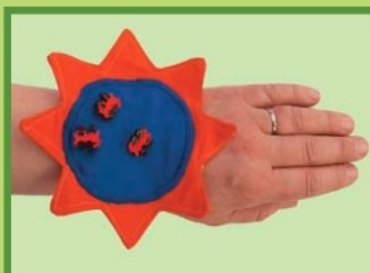
HVĚZDA Motivační pomůcka 7,0907,0001