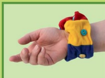
FROTKA Motivační pomůcka 7,0907,0010