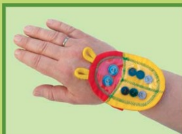
BERUŠKA Motivační pomůcka 7,0907,0002