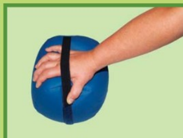
SPASMA VÁLEČEK Ø 15 cm 7,0906,1002