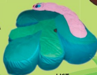
LIST Polohovací lehátko 7,0609,2001