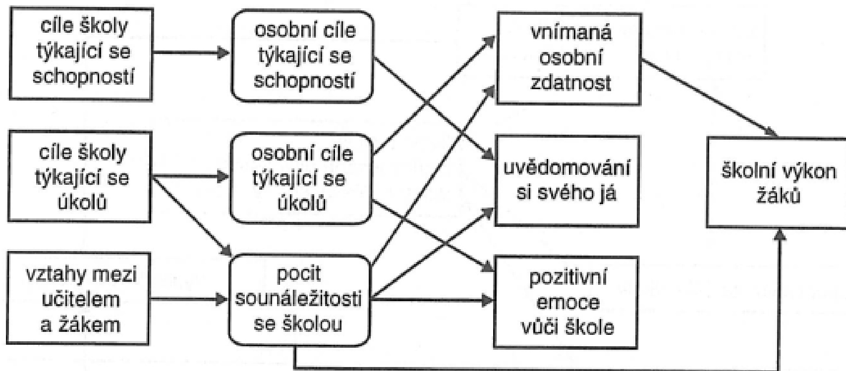
Obr. 20.2 Model klimatu školy (Roesler et al., 1996, s. 416)