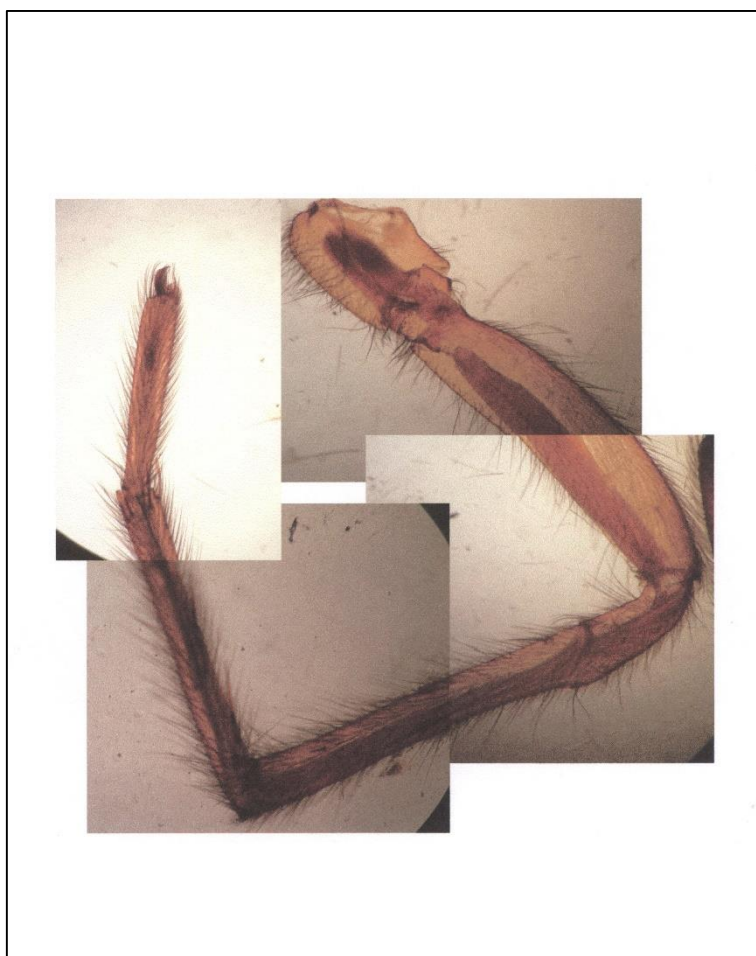
Obr. 70: TTP, končetina pavouka