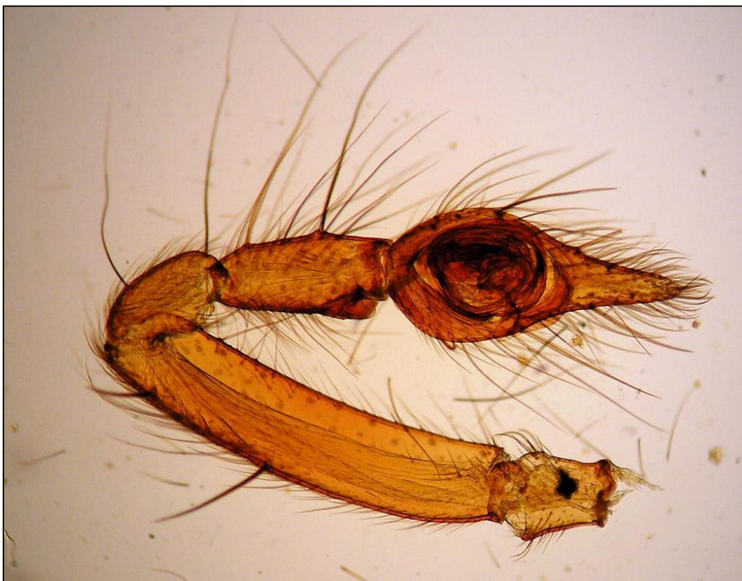
Obr. 65: TP, pedipalpus samce pavouka (40x)