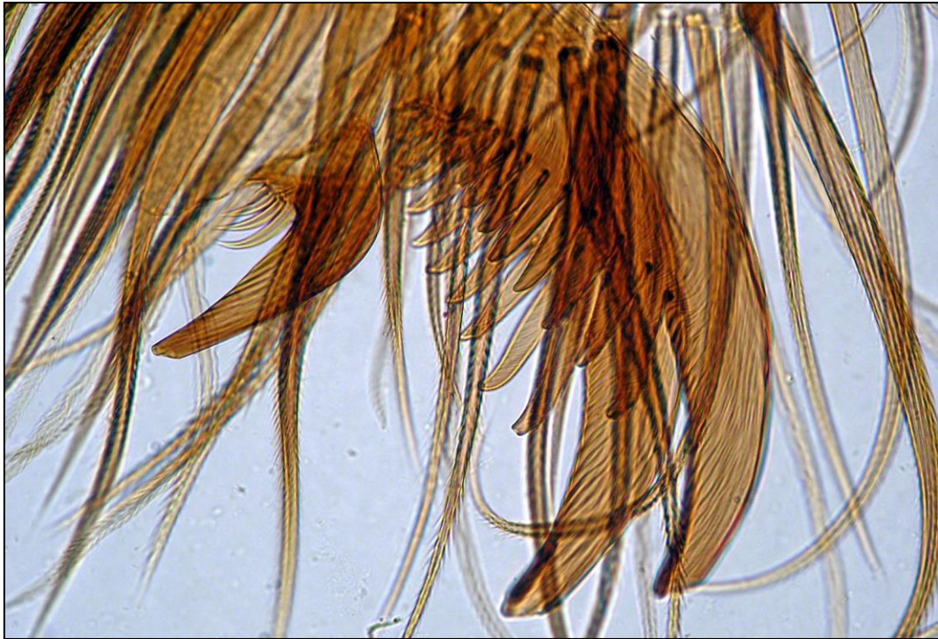
Obr. 67: TP, hřebínky na noze pavouka (400x)