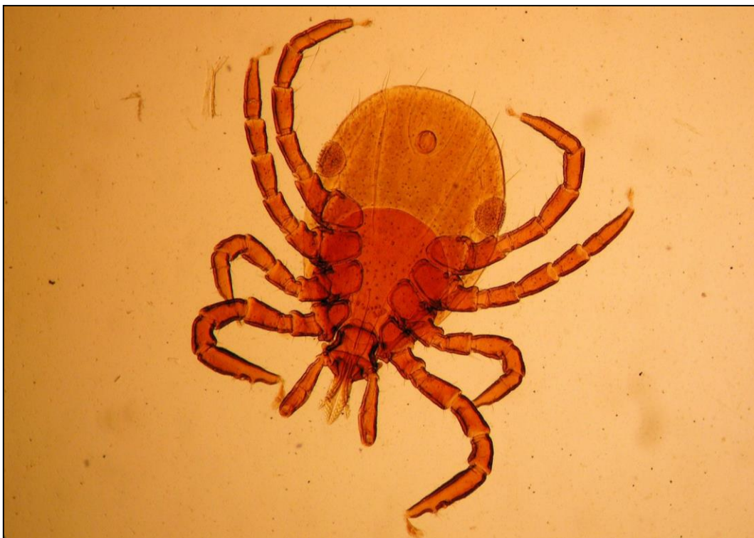
Obr. 69: TTP, nymfa klíštěte (100x)