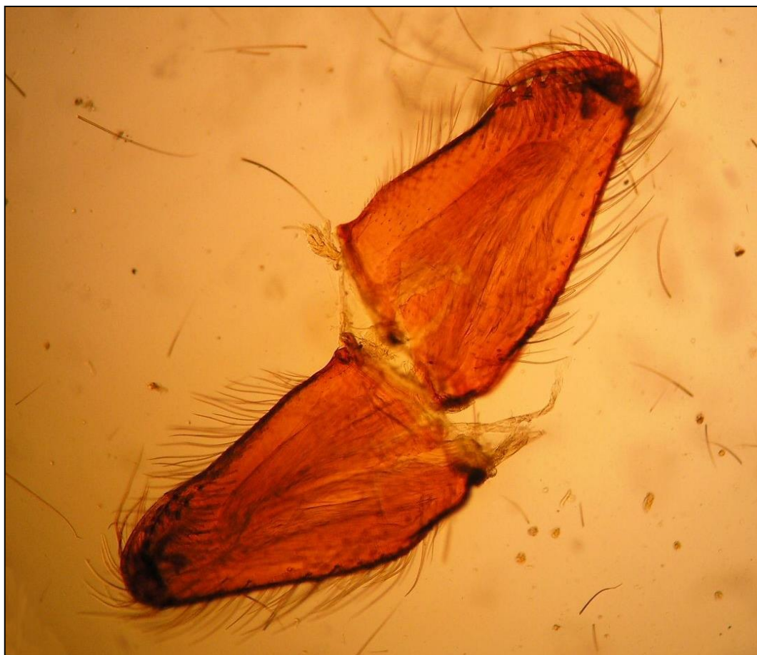
Obr. 68: TP, chelicery pavouka (40x)