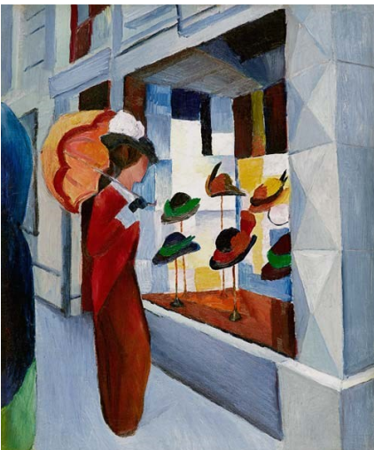
August Macke, Femme avec ombrelle devant un magasin de chapeaux (1914)