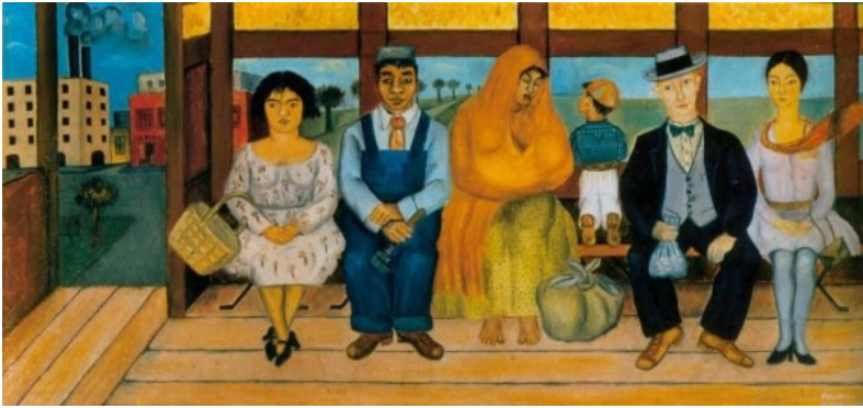
Frida Kahlo, L'Autobus , 1929

1) Choisissez 1 ou 2 ou toutes les 3 images et écrivez votre texte accompagnant ce(s) tableau(x) :