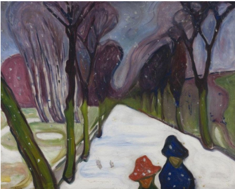
Edvard Munch, Nouvelle neige sur l'avenue , 1906