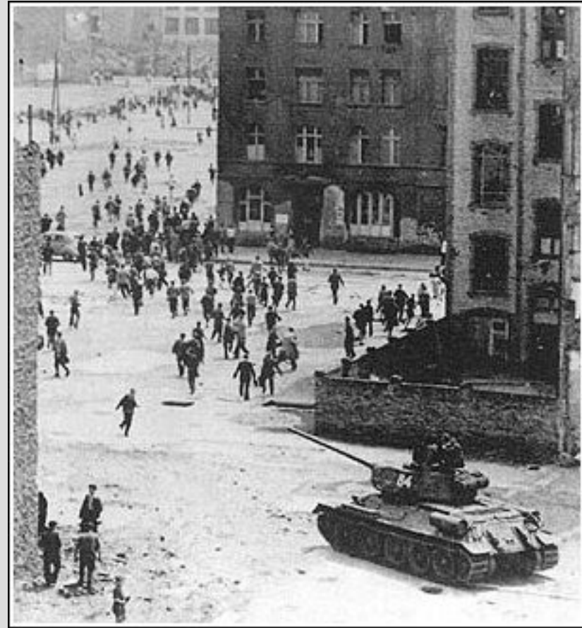
Červen 1953 - NDR – protikomunistické povstání