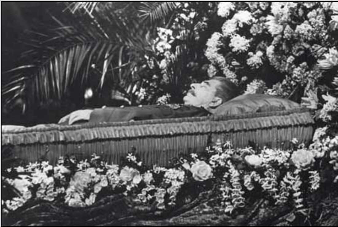
Stalinova smrti 1953