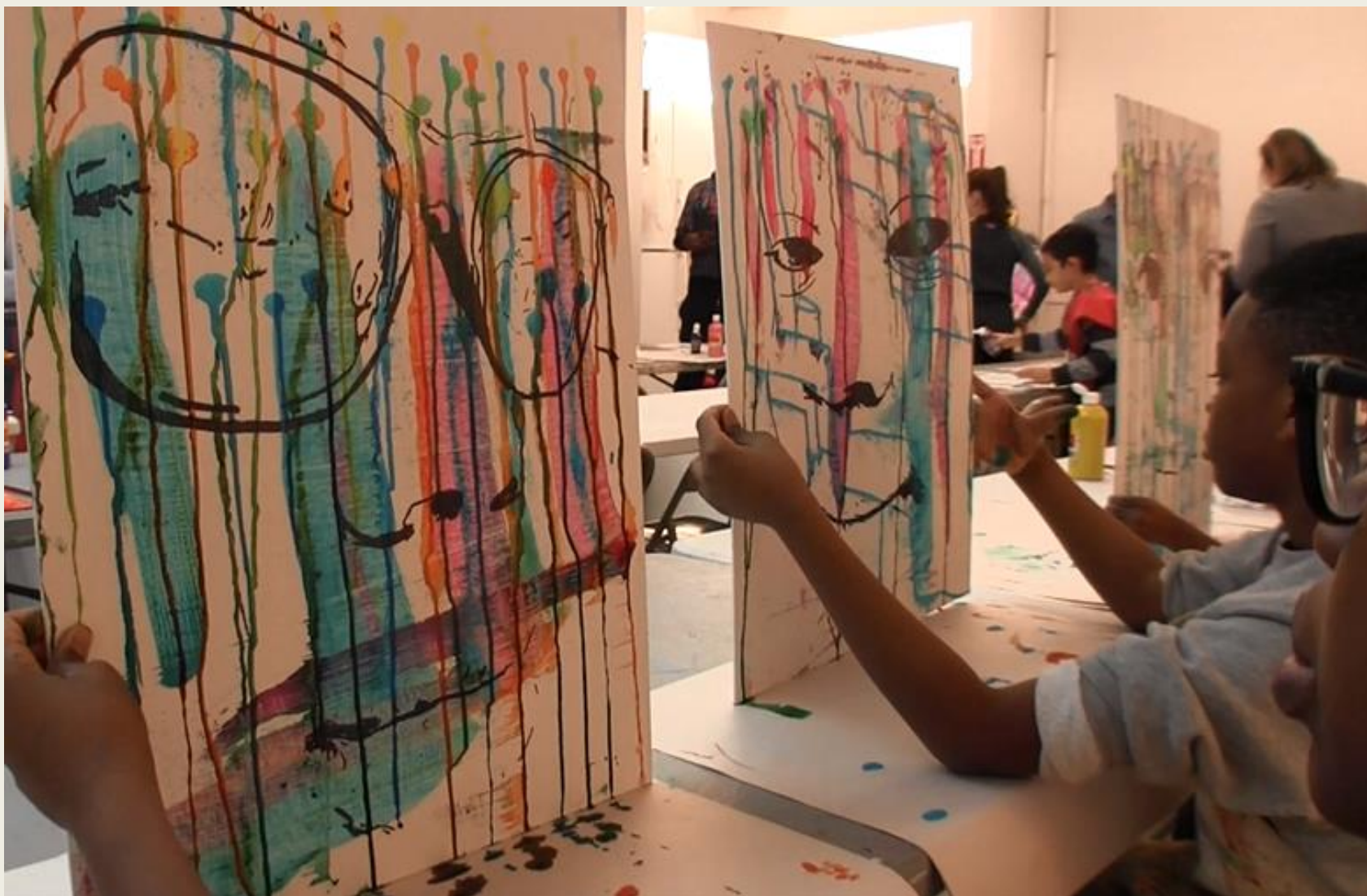
Podzimní les. Art education in PW Gallery. Světové ředitelství Park West Gallery se nachází v Southfieldu v Michiganu , kousek od Detroitu, na krásném pozemku o rozloze 3,5 akrů, včetně přírodního rybníka a sochařské zahrady.