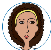
hnědá 30-40 minut