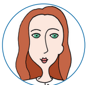
keltská 5-10 minut