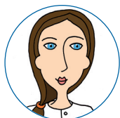
smíšená 15-20 minut