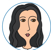
středozevní 20-30 minut