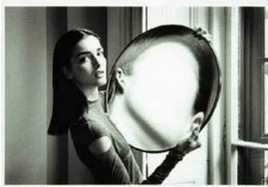
Duane Michals, Magic mirror of uncertainty