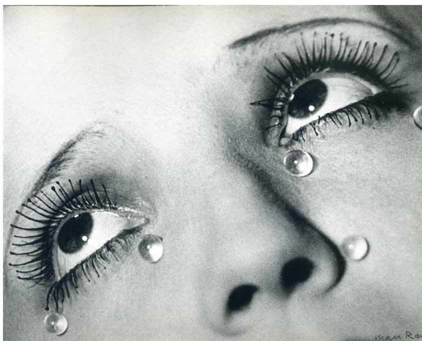
Man Ray, Glass Tears