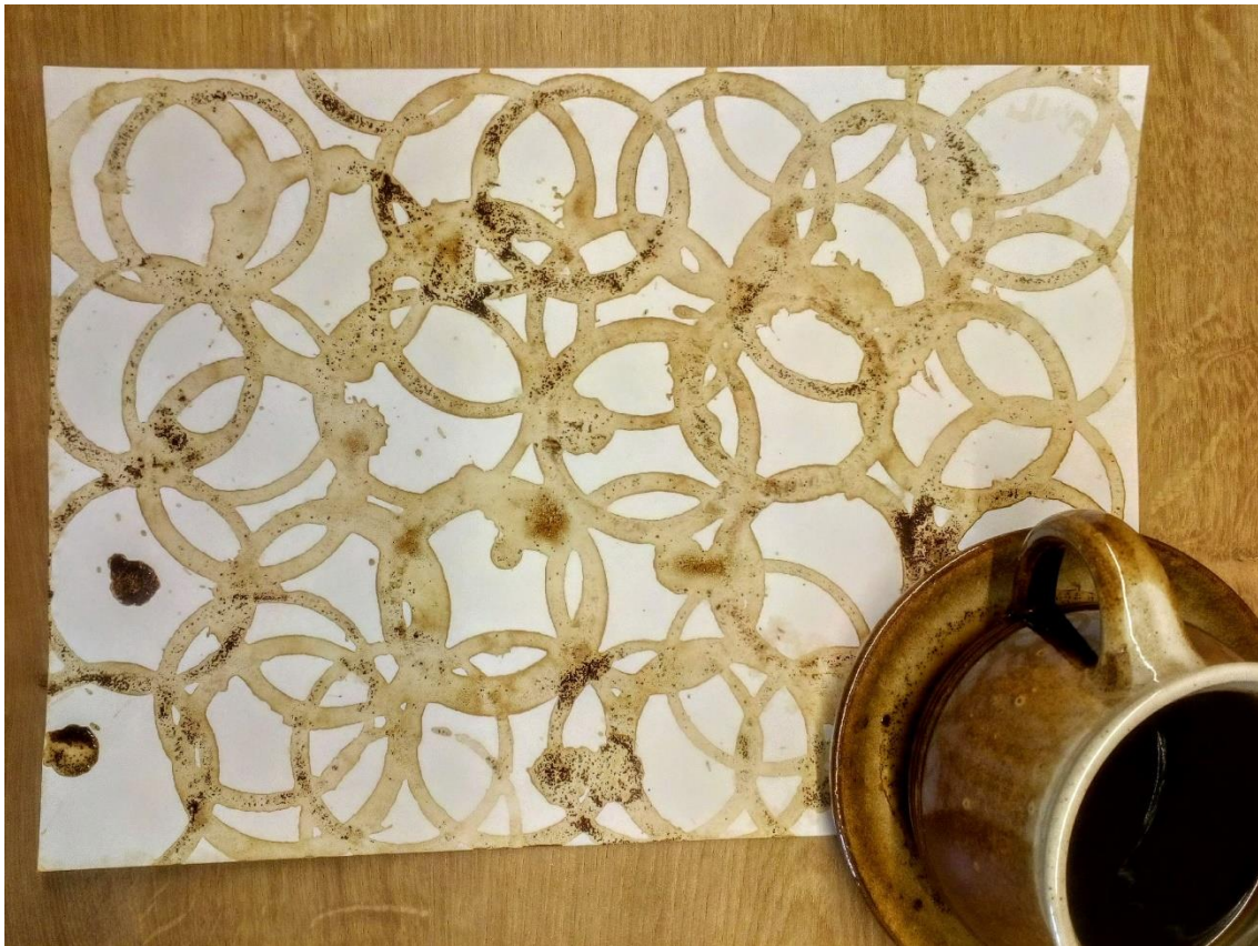
Malba kávou, studentka K.P.