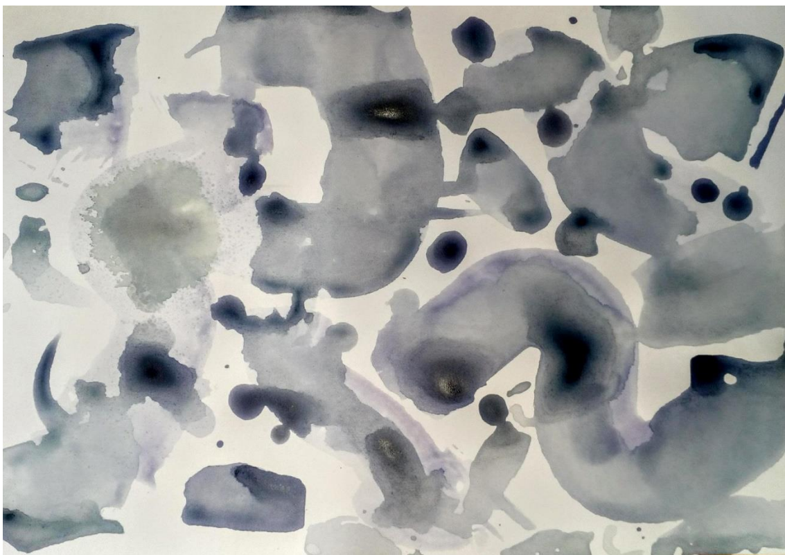
Malba čajem, studentka K.P.