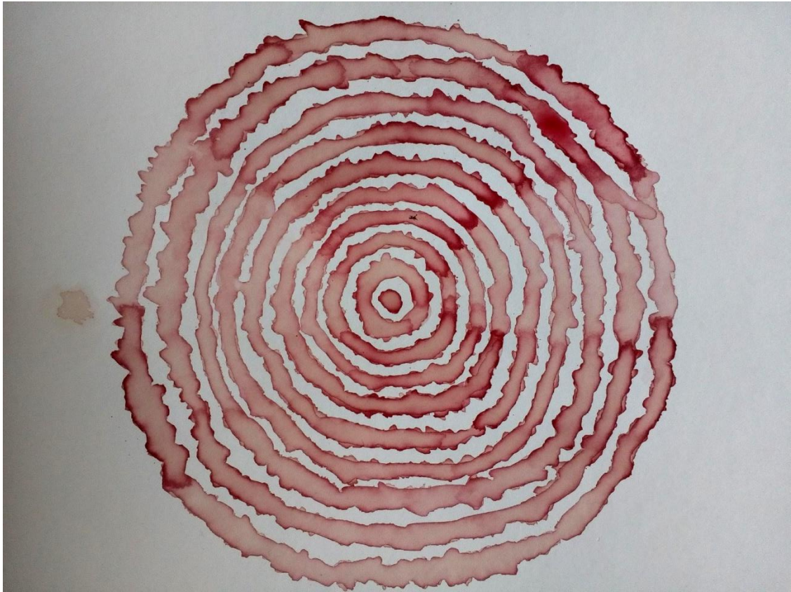
Červená řepa, studentka K.P.