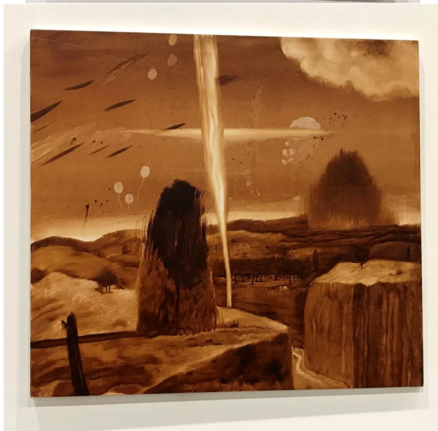
výstava ve Fait Gallery, Brno (2020), „Dva roky prázdnin“