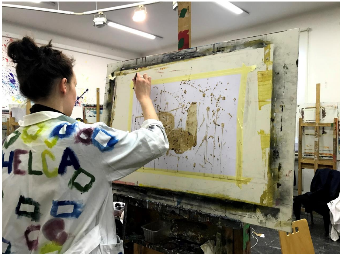
Malba kávou („turkem“), studentka předmětu Umění a tvorba 2