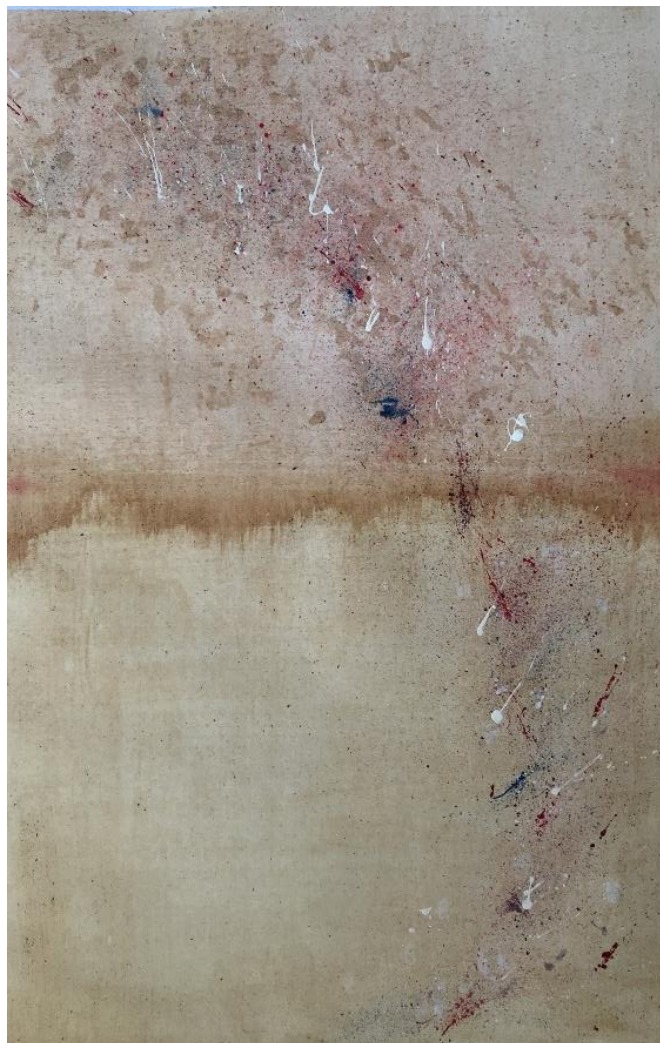
Kombinace malby kávou a akrylovými barvami