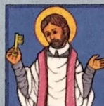
12. Svatý Jan Sarkander