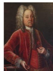
František Antonín hrabě Špork