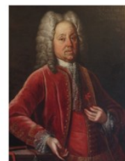
František Antonín hrabě Špork