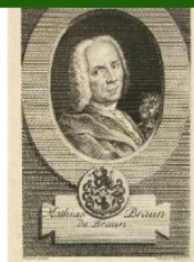
Matyáš Bernard Braun - sochař (1684 – 1738)