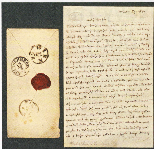
Co Bůh dá? (Dopis bratrovi z Brixenu)

Z dnešního pohledu je zvláštní, že právě tuhle antiruskou linku nedokázalo Bachovo absolutistické Rakousko využít ve svůj prospěch. Stačilo místo internace Havlíčkovi třeba nabídnout, aby své čtenáře strašil jen vnějším, nikoli vnitřním nebezpečím, jak to v následujících desetiletích dě-