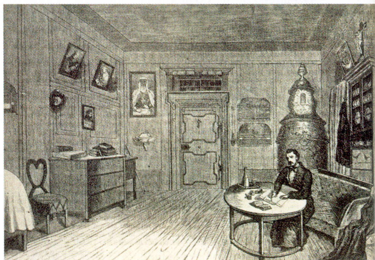
... kde vznikly Tyrolské elegie...