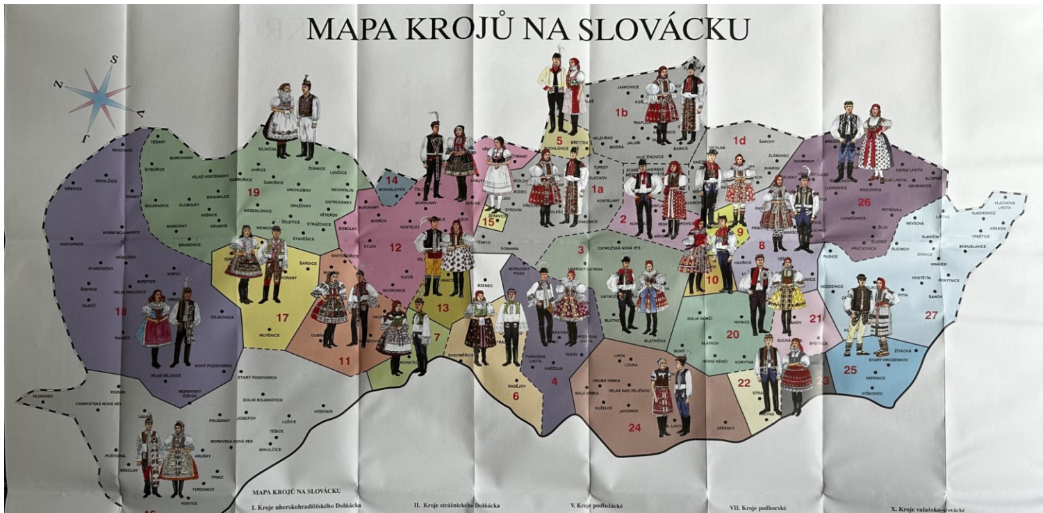
MAPA KROJŮ NA SLOVÁCKU