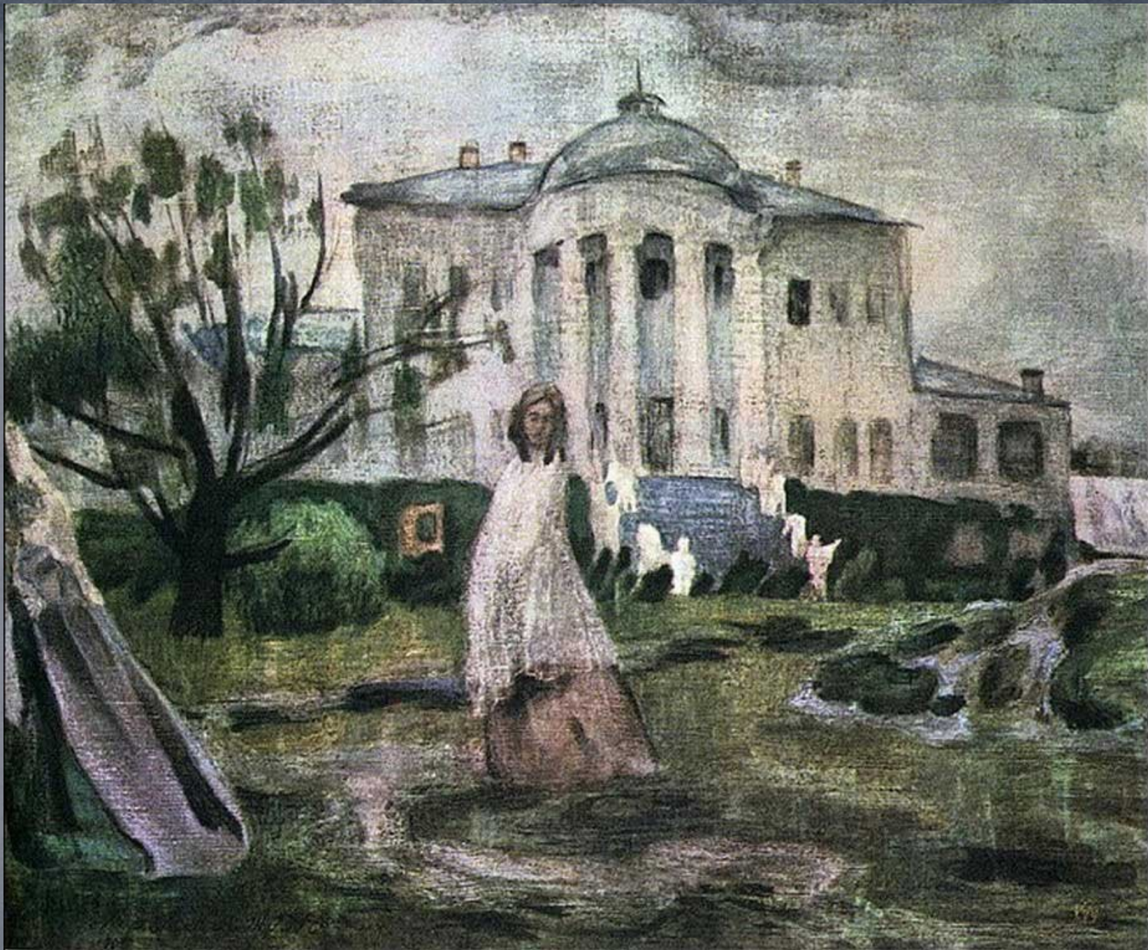
В.Э.Борисов-Мусатов «Призраки», 1903