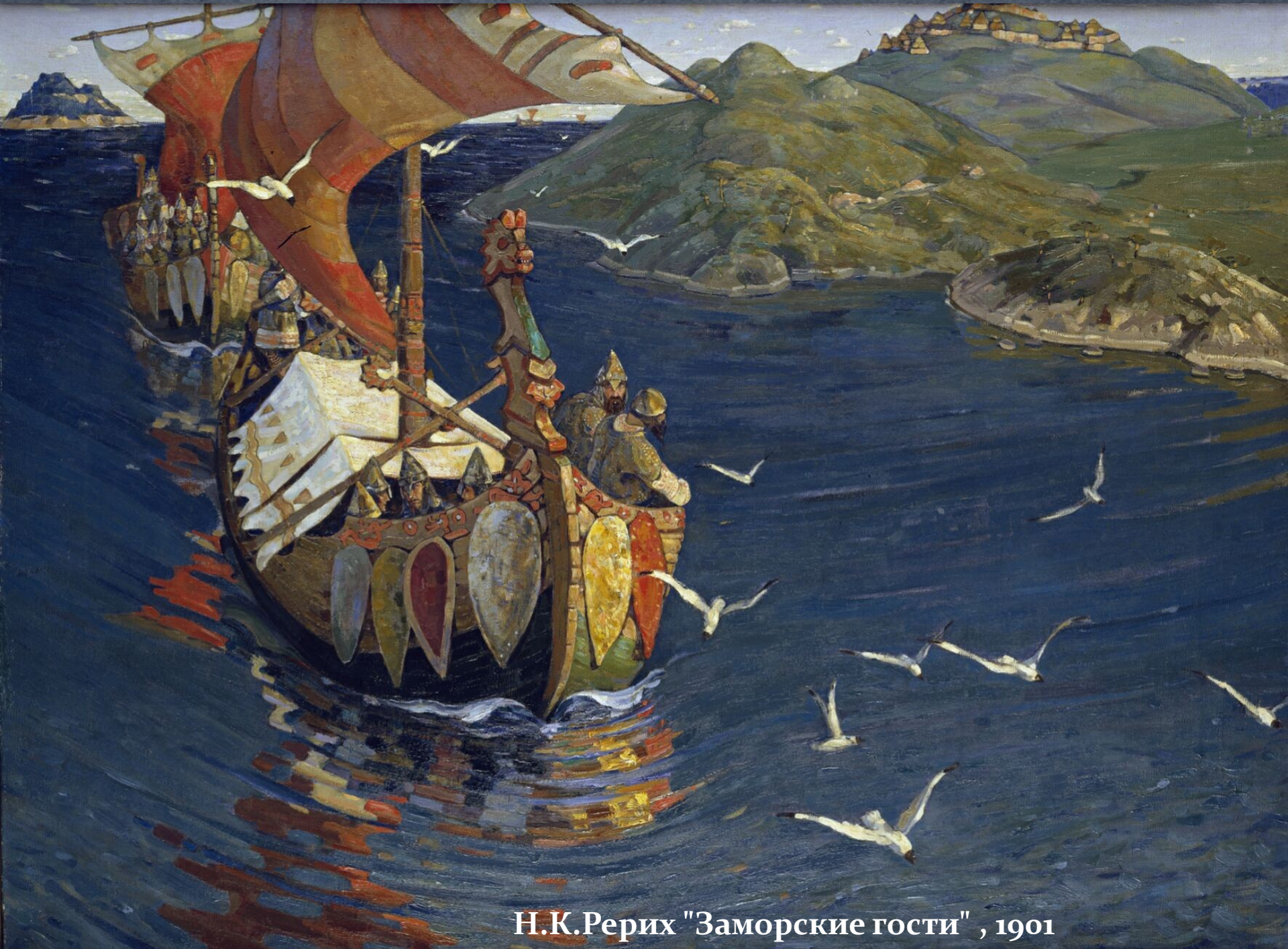
Н.К.Рерих "Заморские гости" , 1901