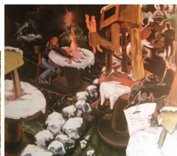
Jörg Immendorf, 1978 Schnee-Café Deutschland