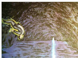
Sandro Chia Modrá jeskyně, 1980