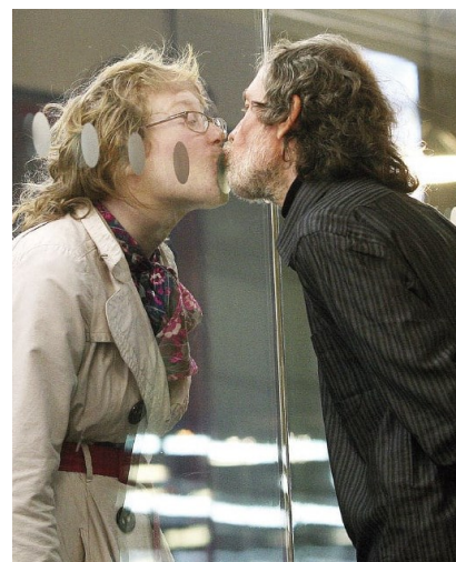
Líbání přes Sklo, Tate Modern 2007