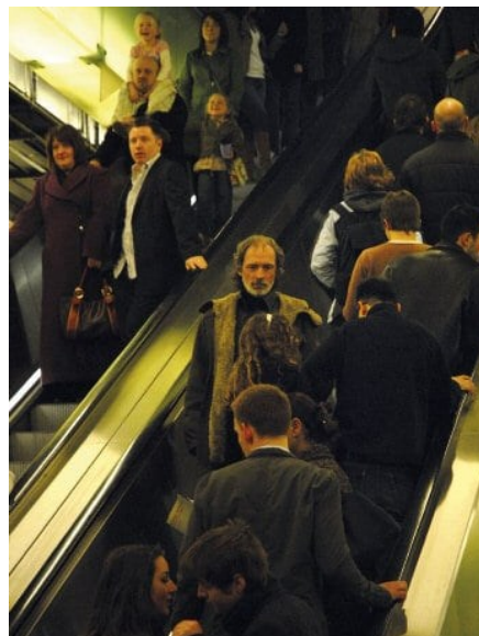
Eskalátor, Tate Modern, 2007