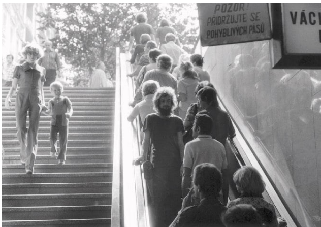
Kontakt, 1977, Václavské náměstí