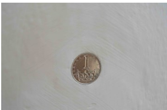
Sto korun českých, Dům umění města Brna 2004